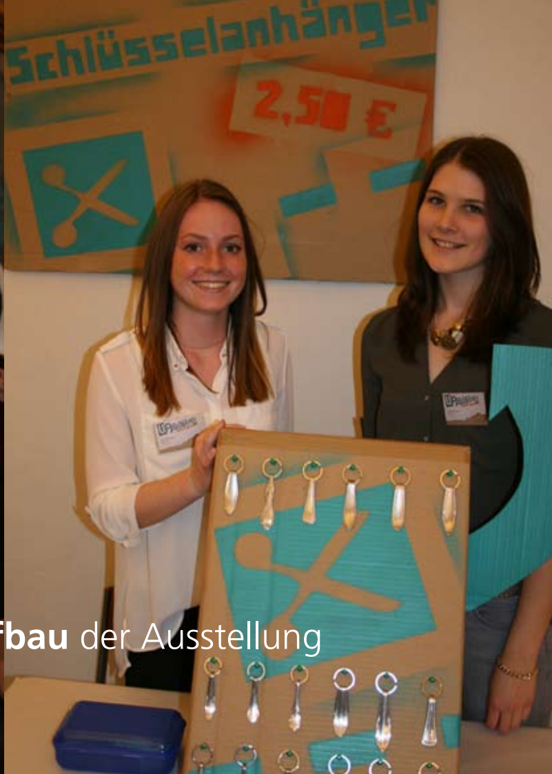
Aufbau der Ausstellung