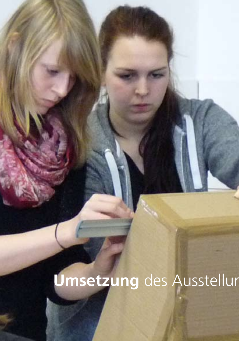
Umsetzung des Ausstellungsdesigns